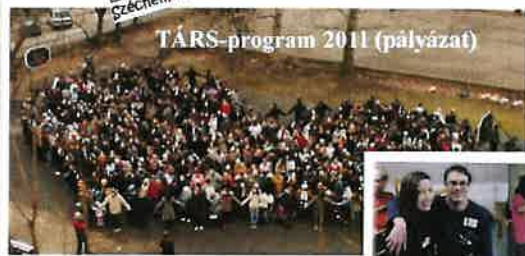
TARS-program 2011 (pályázat)